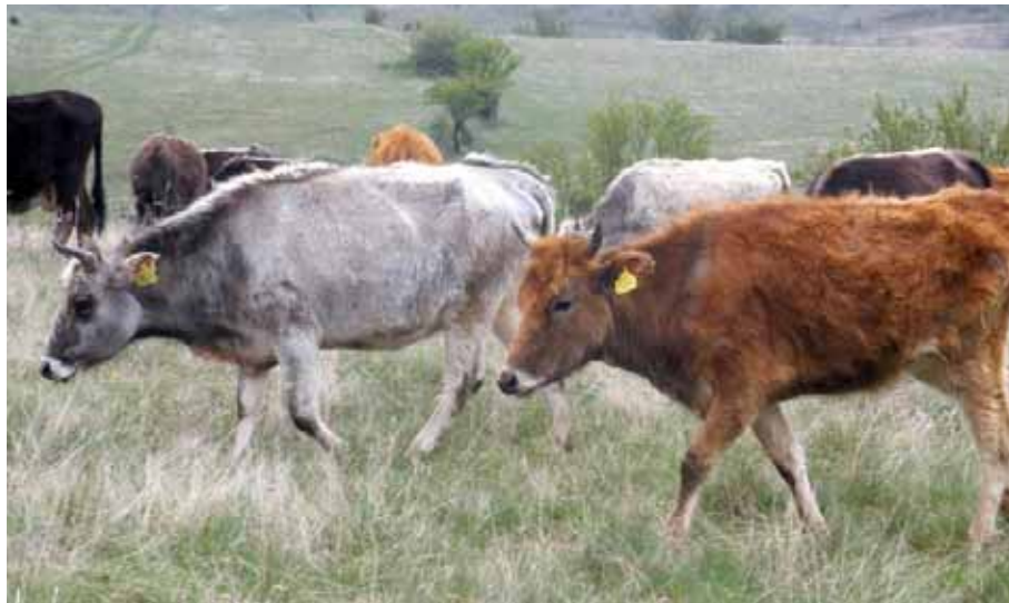
Busha Rinder sind genügsam, robust und resistent gegen viele Krankheiten

Busha Rinder, eine Kurzhornrinderrasse, wurden in allen heutigen Balkanstaaten gehalten. Daher hat sich eine grosse genetische Vielfalt innerhalb dieser Rasse entwickelt. Doch heute gibt es diese robusten Rinder nur noch in kleinen, rapide sinkenden Beständen verstreut über die Balkanländer. Die Erhaltung dieser genetischen Vielfalt ist eine Herausforderung. SAVE Foundation koordiniert den Know-How-Austausch innerhalb der Balkanländer und unterstützt die Erhaltung in kleinen Populationen, die Zucht und die Vermarktung. Ein erster Expertenworkshop fand 2008 in Pogradec, Albanien, statt.